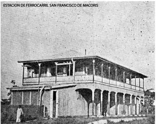
ESTACION DE FERROCARRIL SAN FRANCISCO DE MACORIS